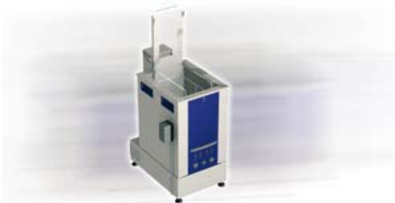
Aparat individual cu sistem oscilator