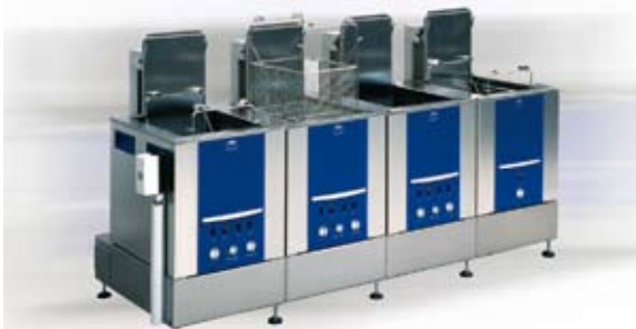
Instalație manuală cu 4 module, cu uscător și oscilații