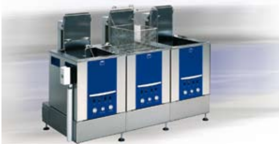
Instalație manuală cu 3 module, cu oscilații