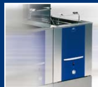
Uscător cu aer cald