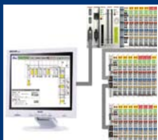
Tablou de comandă în varianta Touchpanel