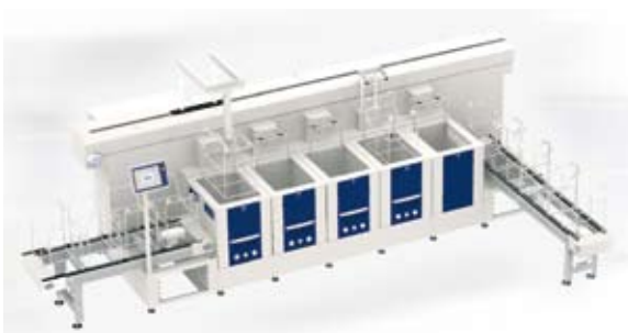
Instalație cu 4 module, echipată cu robot și uscător