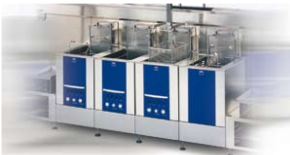
Linie de curățire complet automatizată, cu bandă de încărcare și descărcare